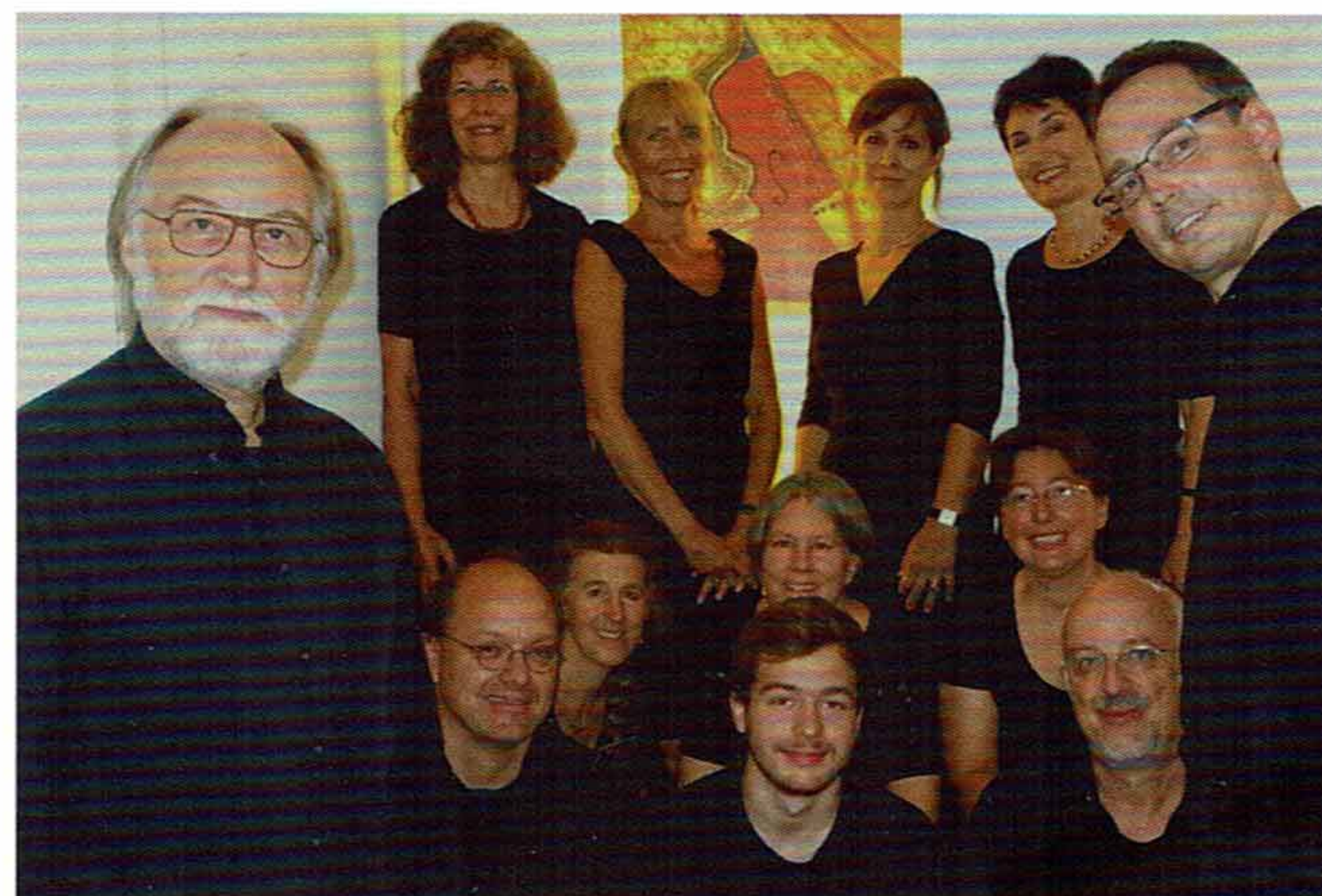
und das "Ensemble 17"